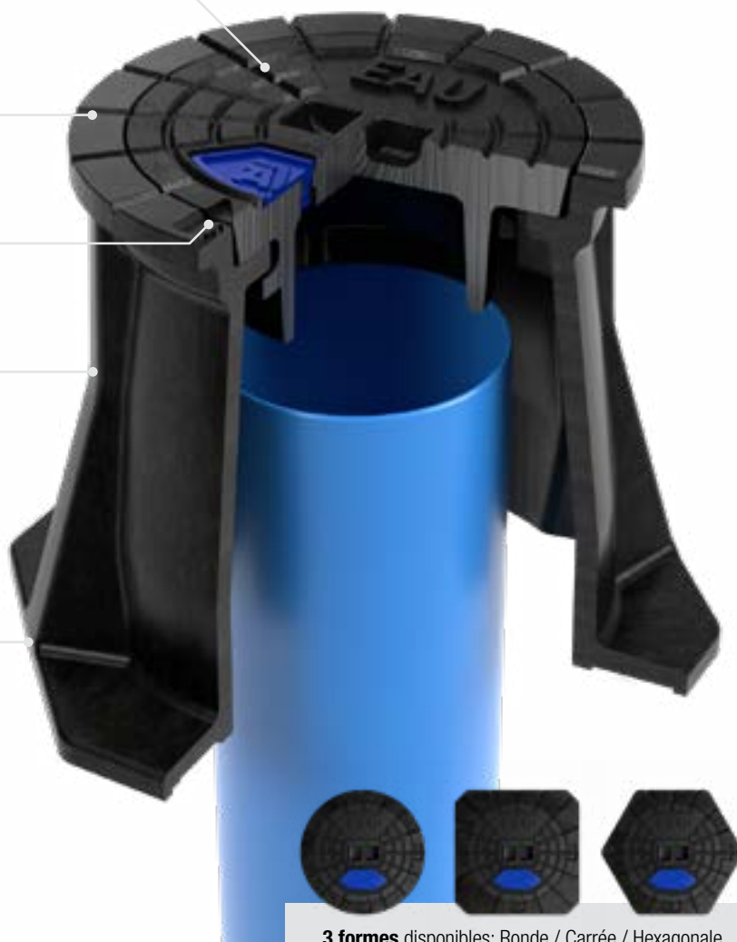
3 formes disponibles: Ronde / Carrée / Hexagonale

Le corps est fabriqué à l'aide de matériaux issus du recyclage et 100% recyclable à moindre énergie en fin de vie. BACfixe: une solution écologique avec une empreinte carbone réduite, du processus de fabrication, jusqu'à la fin de vie des produits.