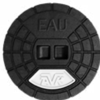
Recherche de fuites en cours