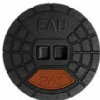
Assainissement et Pluvial