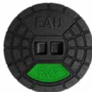
... (au choix)